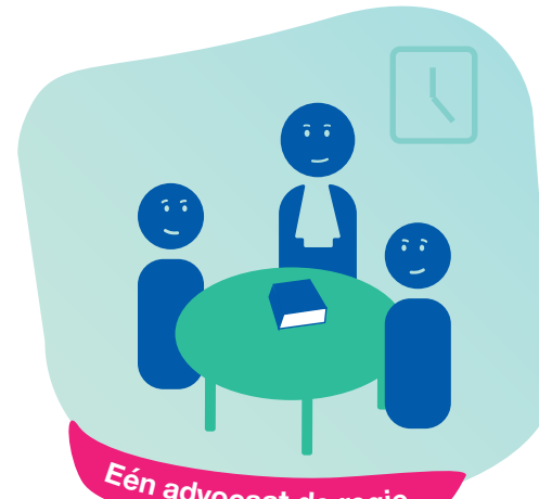
Eén advocaat de regie