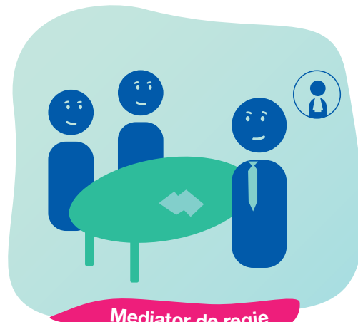
Mediator de regie