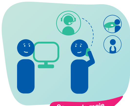
Samen de regie