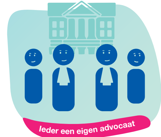
Ieder een eigen advocaat