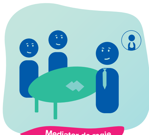
Mediator de regie