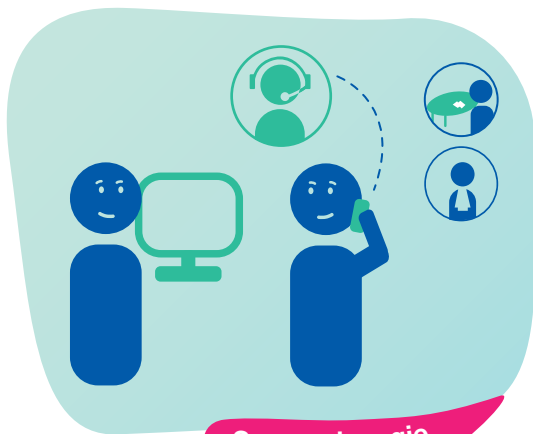
Samen de regie