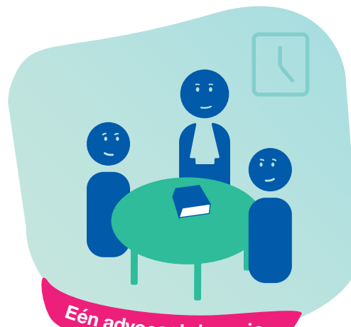
Eén advocaat de regie