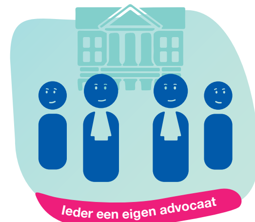
Ieder een eigen advocaat